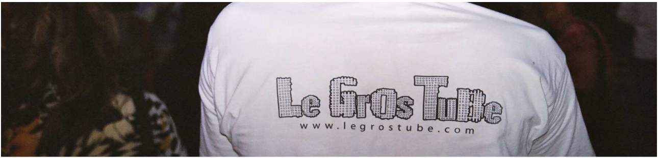
FICHE TECHNIQUE Le gros tube – www.legrostube.com